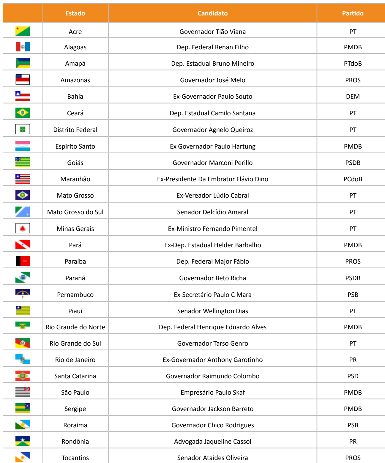
Tabela de Resultados

O Partido Republicano da Ordem Social (PROS) realizou convenções, durante o mês de junho, no Distrito Federal e em todos os estados do Brasil para decidir qual o candidato a governador apoiar em cada parte da federação. O PROS apoia os seguintes candidatos a governo do estado: