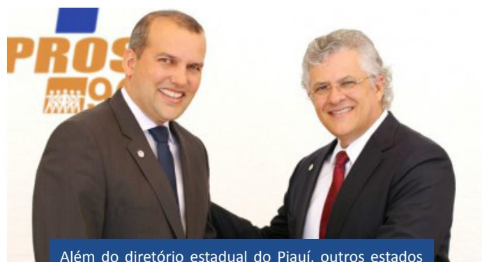
Além do diretório estadual do Piauí, outros estados têm se reunido para definir nomes de pré-candidatos para o ano que vem

Durante a conversa, alguns integrantes mostraram interesse em disputar as eleições pelo partido e informaram que estão realizando reuniões para a escolha de nomes que tenham a aceitação da população, com capacidade real de ser o melhor representante da população.