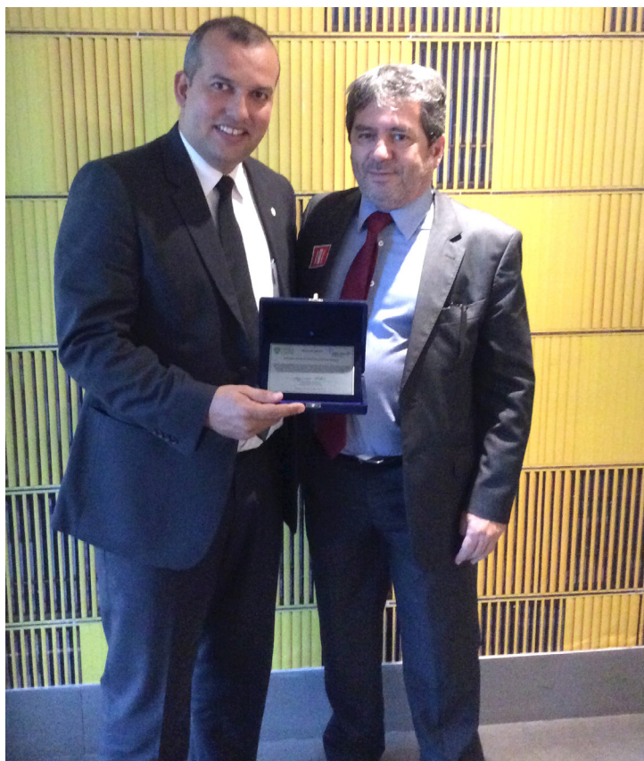
Presidente nacional do partido, Euripedes Junior, considera o mercado livre de energia um direito do cidadão

No início de Novembro, o presidente nacional do PROS, Euripedes Junior, foi reconhecido pela Abraceel como personalidade que contribuiu significativamente para a evolução do mercado livre de energia. Durante a reunião, o gestor do partido foi homenageado por seu esforço e dedicação em prol do setor.