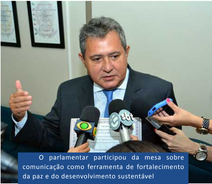
O parlamentar participou da mesa sobre comunicação como ferramenta de fortalecimento da paz e do desenvolvimento sustentável