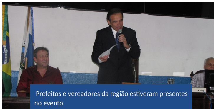
Prefeitos e vereadores da região estiveram presentes no evento

No encerramento das atividades, o PROS-RJ deu posse a integrantes das executivas municipais de Belford Roxo, Duque de Caxias, Itaguaí, Magé, Mesquita, Queimados, São João de Meriti e Seropédica.